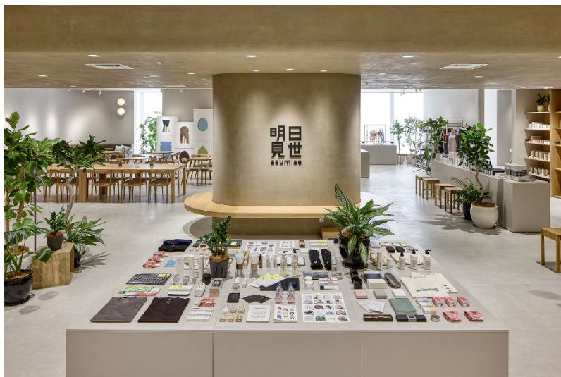
* 明日見世の全体イメージ

*2：コウジ酸の詳細 https://www.dermed.jp/store/s/technology/kojicacid/ （三省製薬による実験）。